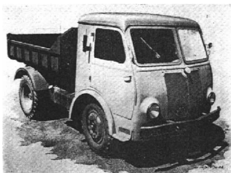
STAR – 25

Pierwsi uczniowie naukę zawodu rozpoczęli w styczniu 1971 roku po przeniesieniu z Lubawy. Na przestrzeni czasu zmieniały się kierunki kształcenia zawodowego , czego powodem było dostosowanie profilu nauki do bieżącego zapotrzebowania firmy na fachowców z danej dziedziny. Kształcono więc początkowo mechaników maszyn i urządzeń rolniczych, mechaników pojazdów samochodowych, następnie ślusarzy – mechaników. Przyszli mechanicy pojazdów samochodowych swoje umiejętności kształcili uczestnicząc między innymi w remontach kapitalnych samochodów STAR – 25, z kolei mechanicy maszyn i urządzeń rolniczych w remontach ciągników rolniczych C – 4011, C – 355 a także kombajnów zbożowych BIZON. Uczniowie podczas nauki „przechodzili” również przez poszczególne działy np. ślusarnię, kuźnię, stację kontroli pojazdów.