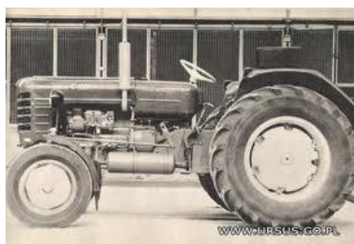
C – 4011

Z chwilą powstania spółki kształcono ślusarzy . W roku 2007, z uwagi na duże zapotrzebowanie pracowników działu obróbki skrawaniem utworzono kolejny kierunek kształcenia tj. operator obrabiarek skrawających . Natomiast w roku szkolnym 2015 / 16 pierwsi uczniowie rozpoczęli naukę zawodu LAKIERNIK .